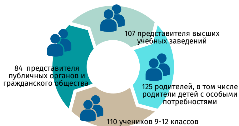
Фиг. Пример консультативного процесса по образованию

Посредством реализации программных документов автономия рассчитывает внести свой вклад в лучшее будущее молодого поколения, экономический рост и устойчивое развитие Гагаузии.